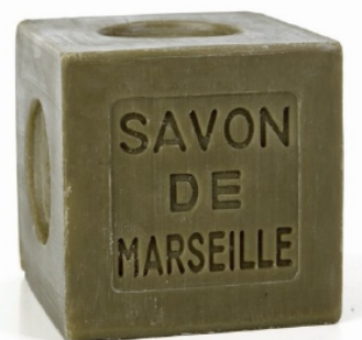
Fig. 1. Savon de Marseille